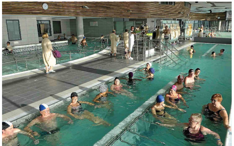
■ Balaruc-les-Bains est devenue la deuxième station thermale d'Europe !

Puis, Montpellier et sa célèbre école de médecine se penchent sur la question vers le XI e siècle. Elle sera recon-