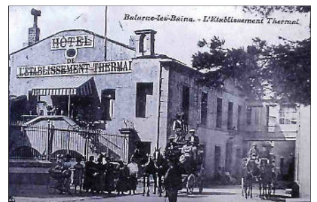
■ La reconnaissance de l'eau thermale date de 1866.

► Samedi prochain, dernier volet de notre série avec un gros plan sur le thème Voir et entendre les eaux souterraines... et quelques légendes anciennes.